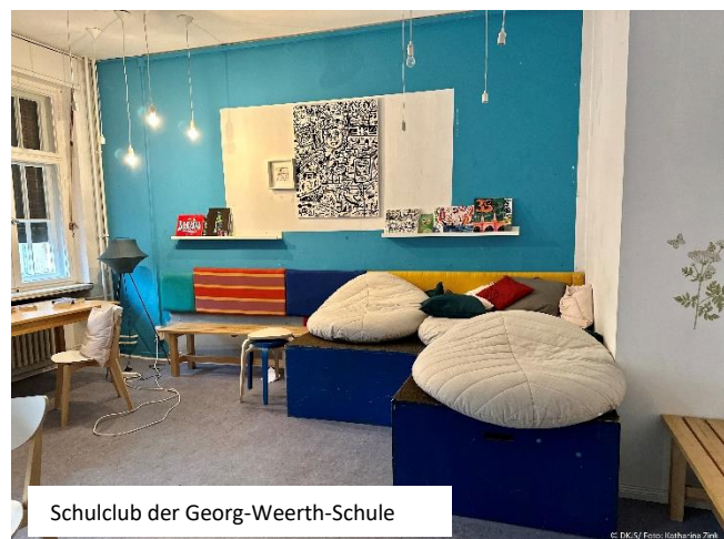
Schulclub der Georg-Weerth-Schule